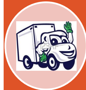
6. Mayoristas y exportadores