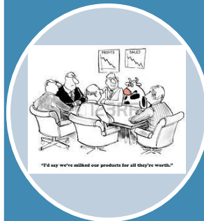
3. Organizacio n es