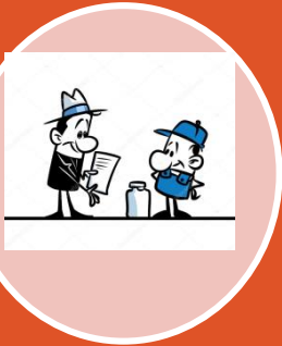
1. Proveedores de insumos